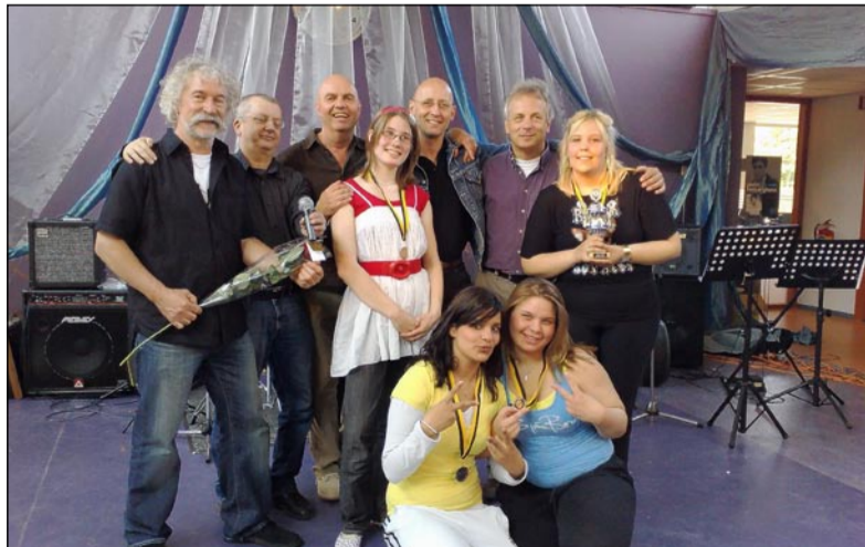
Het Tielse scholierentalent ging vrijdag goed tekeer op de Rozenstraat.